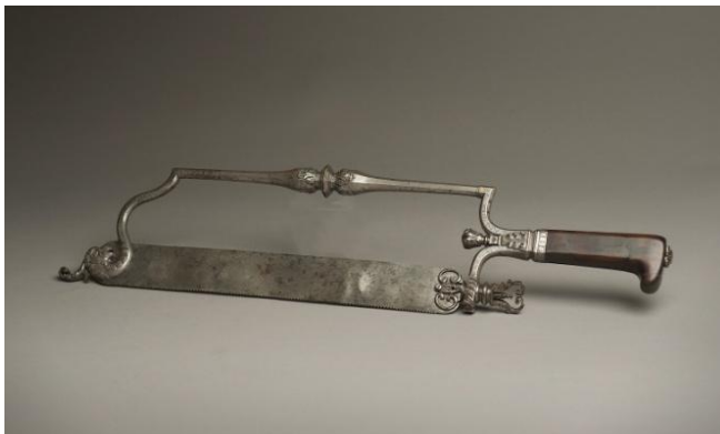
De zaag en .....

Bij hoge koorts tapte hij met bloedzuigers bloed af, dan zakte de koorts. Hij kon arm- of beenbreuken zetten. Een kundig chirurgijn kon in 2 tot 3 minuten ledematen amputeren, ja, we dan hebben het over .....afzagen! De arme zeeman kreeg eerst een flinke hoeveelheid sterke drank te drinken en een stevige lap tussen de tanden om de pijn te verbijten.